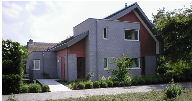
Marga Klompélaan 3